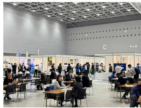
※令和5年度開催時(Gメッセ群馬で開催)